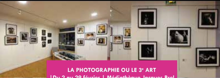
LA PHOTOGRAPHIE OU LE 3 e ART | Du 2 au 29 février | Médiathèque Jacques Brel