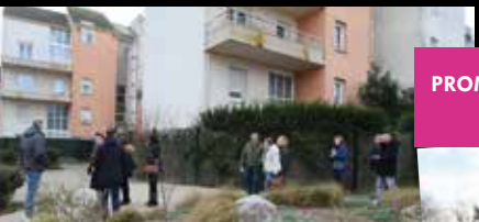
PROMENADE DE QUARTIER "LA NACRE" | Mercredi 31 janvier |