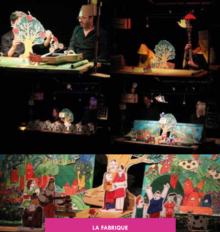
LA FABRIQUE | 25 et 26 janvier | Théâtre du Thelle