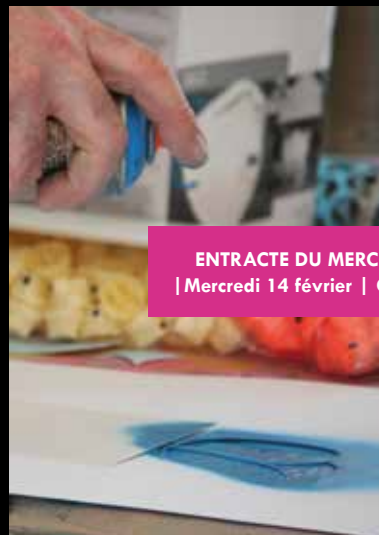
ENTRACTE DU MERCREDI / AVEC MICOWÈL | Mercredi 14 février | Centre culturel Le Domino