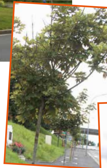
Érables, rue Vaillant Radiologue

Un diagnostic spécifique a également été effectué en 2019 dans toutes les cours d'école.