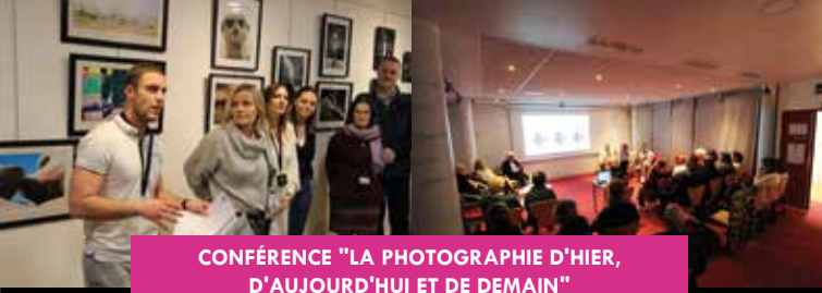
CONFÉRENCE "LA PHOTOGRAPHIE D'HIER, D'AUJOURD'HUI ET DE DEMAIN" | Vendredi 16 février | Médiathèque Jacques Brel