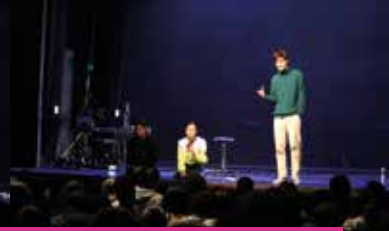
"MIDI NOUS LE DIRA" | 8 et 9 février | Théâtre du Thelle