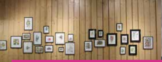
VERNISSAGE DE L'EXPOSITION "PERSÉVÉRANCE UN AUTRE MONDE EST-IL POSSIBLE #3" - MICOWÈL | Samedi 3 février | Centre culturel Le Domino